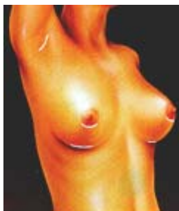
LOCALIZACIÓN DE LAS CICATRICES